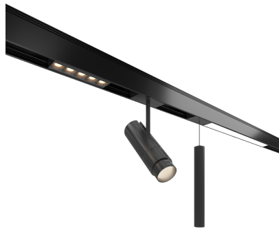
Alina Master Monté en Surface